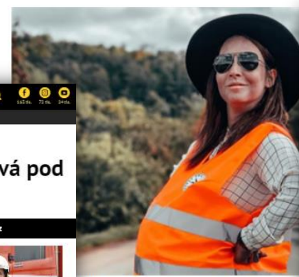
HEREČKA VERONIKA ARICHTEVA V RÁMCI KAMPANĚ

Instagramový profil Policie České republiky má nyní více než 179 tisíc sledujících, žáků, kteří sledují, jen účty jiných osobností. V těchto dnech však začala sledovat i Veronika Arichteva a Berenika Kohoutová. Jsou krásné, jsou slavné a jsou úspěšné. A ještě je sledují tisíce lidí. Berenika Kohoutová (29) a Veronika Arichteva (34) se nyní dostaly do hledáčku České policie. Proč?