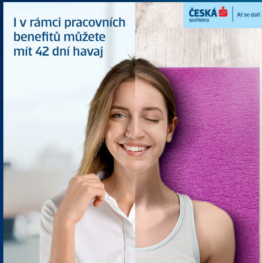
Vizuál 42 dní volna